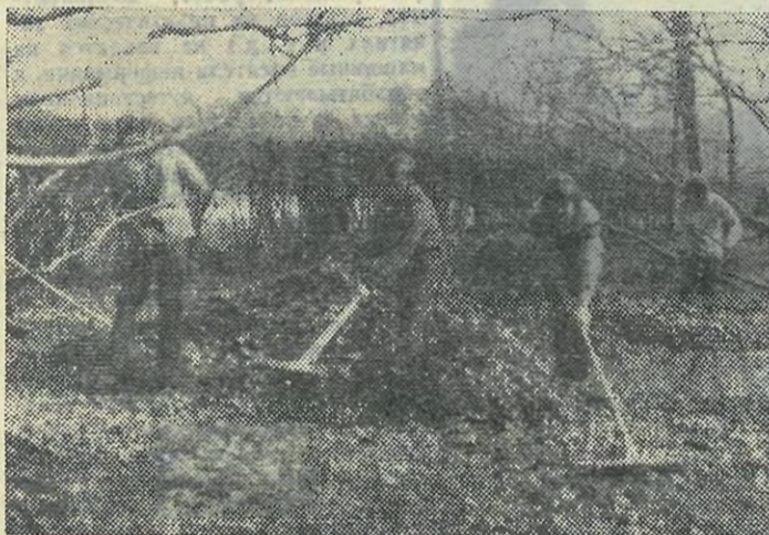
НА СНИМКЕ: бойцы стройотряда «Нева» за работой.

Фото и текст А. БОГДАНОВА, нашего студкора, гр. 351