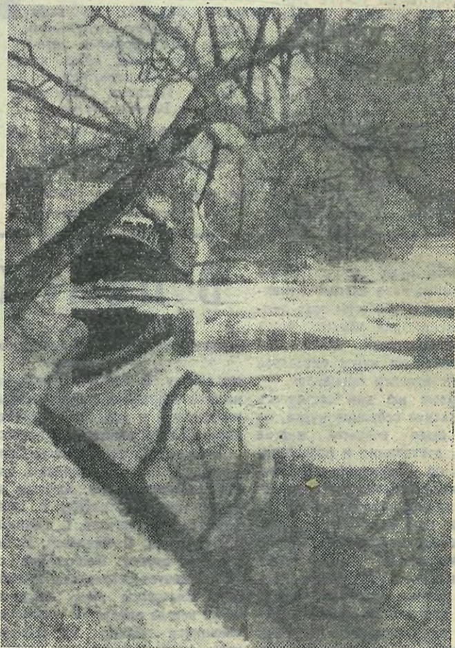
Простор, затопленный весной, весной, весной бездонной...