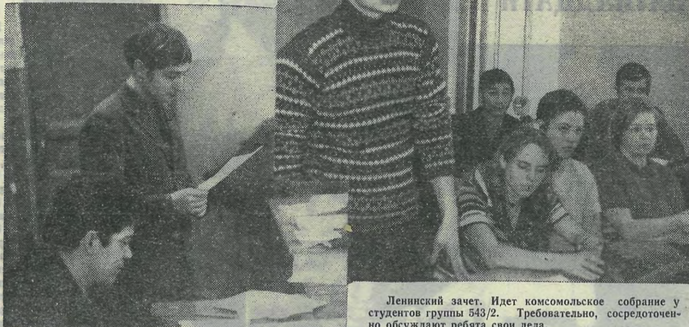
Ленинский зачет. Идет комсомольское собрание у студентов группы 543/2. Требовательно, сосредоточенно обсуждают ребята свои дела.

При проведении Ленинского зачета на факультете вновь встал вопрос о шаблонности и, в ряде случаев, неконкретности принимаемых соображений — как личных, так и коллективных. В