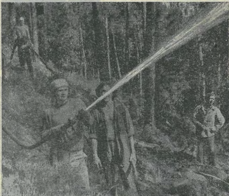
Приходилось и тушить лесные пожары. На снимке: бойцы отряда «Факел»