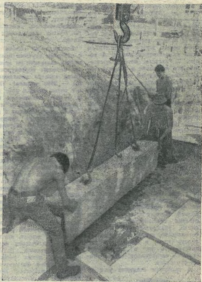
Укладка фундамента. Отряд «Ладога».