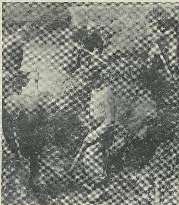
На снимке: немало упорства и выдержки требуется от бойцов ССО при работе в жарких летних условиях. Лучшей бригаде отряда «Горизонт» буквально не страшны были ни холод, ни жара. Она постоянно перевыполняла установленные плановые задания без каких бы то ни было отклонений в производственном процессе.