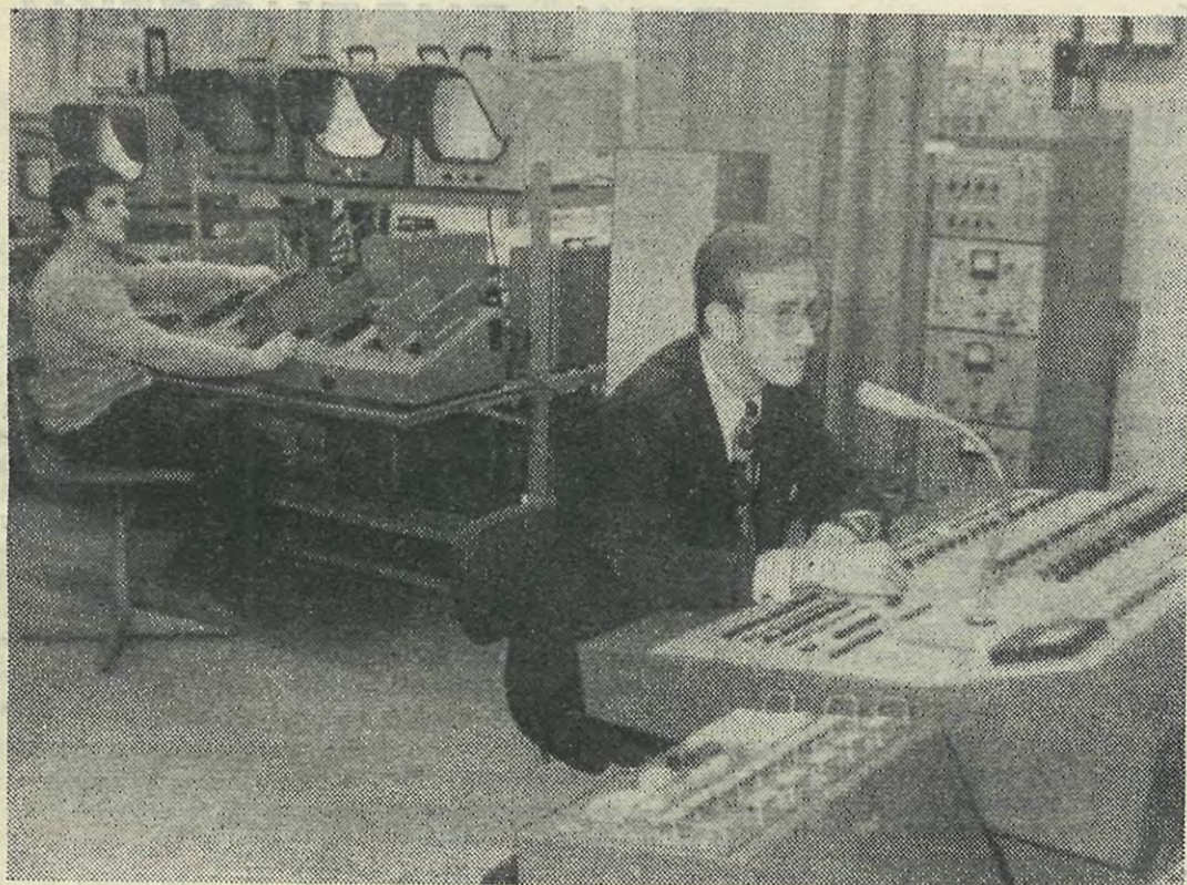
Наш институт в последние годы все больше и больше оснащается техническими средствами обучения. Активно внедряется в учебный процесс телевидение. Недавно телевизионное оборудование получил ряд аудиторий гидротехнического факультета. На снимке: аппаратная центра учебного телевидения.