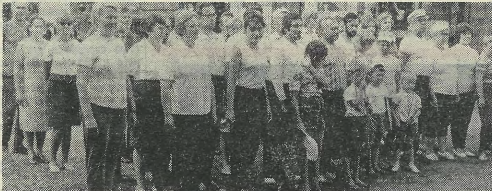
В спортивном лагере ЛПИ.