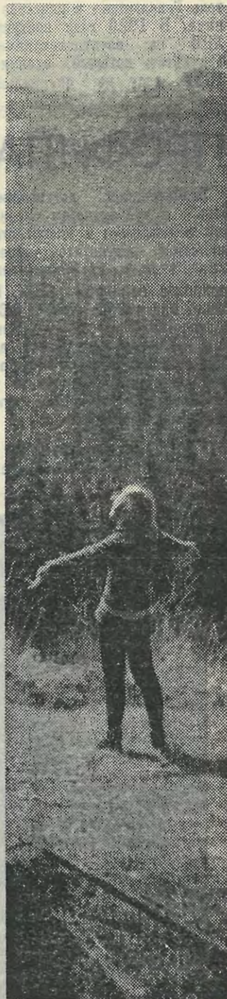
Вот она формула бесконечности.