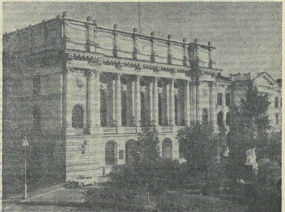
Фасад главного здания ордена Ленина политехнического института имени М. И. Калинина Справа — памятник В. И. Ленину.