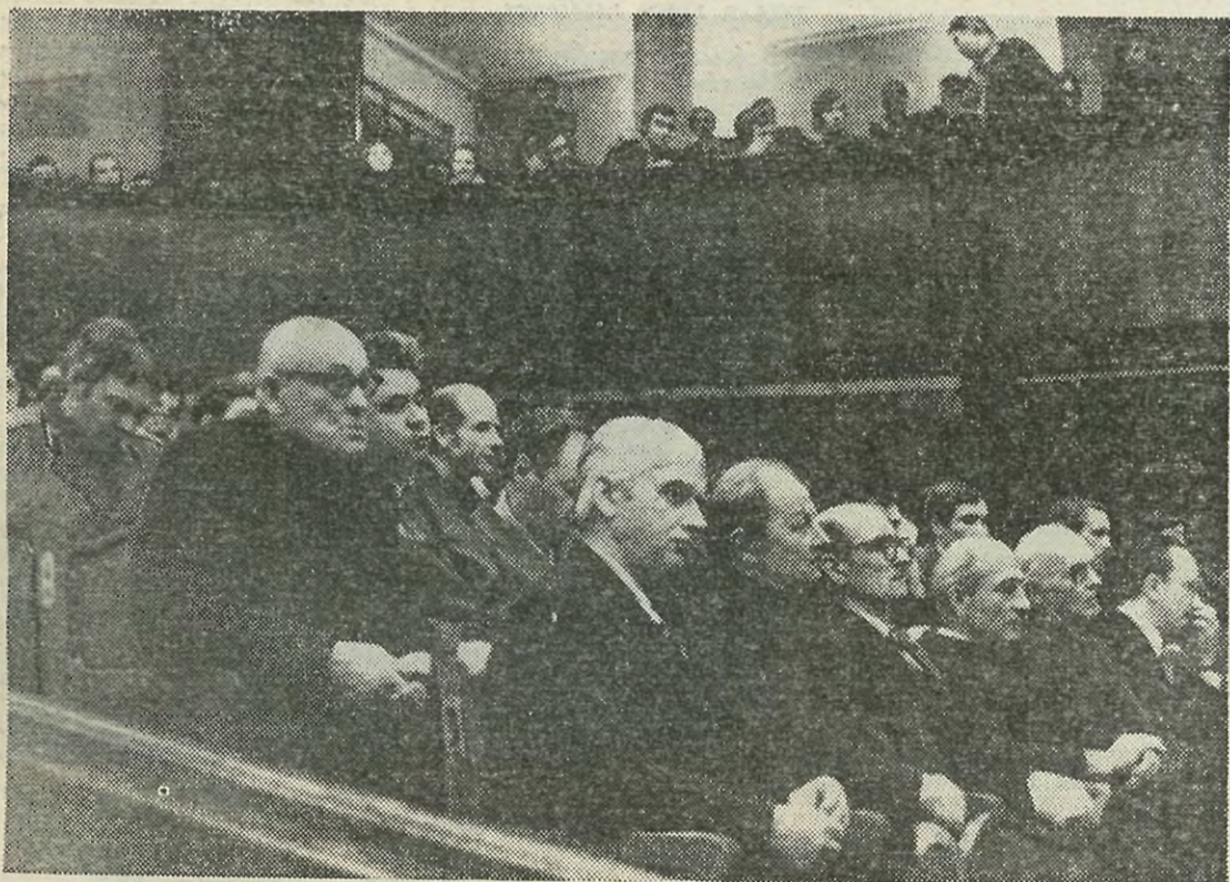
В зале заседания.

Л. А. НОВИКОВ, заместитель секретаря партбюро ОКБ ТК по идеологической работе