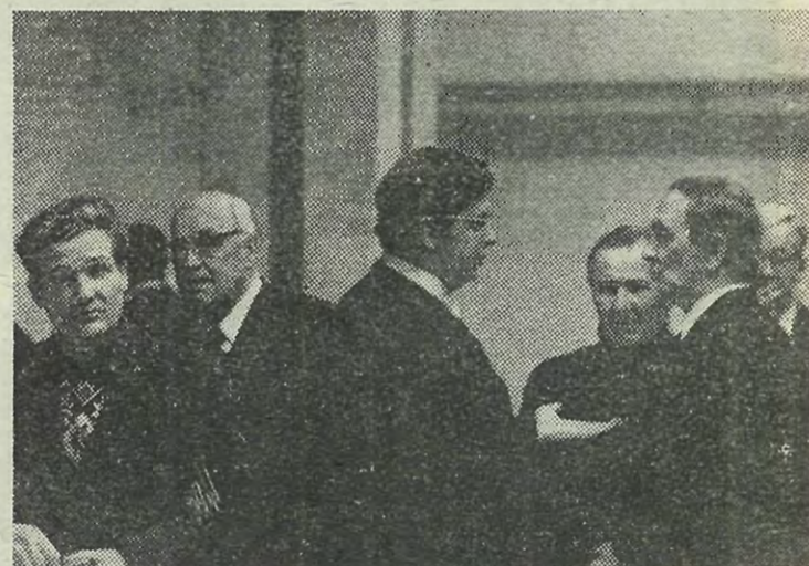
В перерыве партийного собрания.

Заканчивается первый год X пятилетки. Октябрьский (1976) Пленум Центрального Комитета КПСС призывает коммунистов, комсомольцев, всех трудящихся еще шире развернуть социалистическое соревнование за успешное выполнение заданий пятилетки. Откликаясь на этот призыв, коммунисты, весь коллектив нашего института должны внести свой вклад в подготовку специалистов для народного хозяйства.