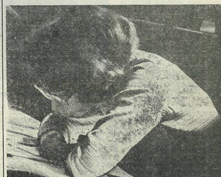
Устремленность.