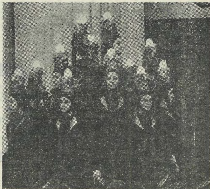
На снимках: наши друзья из ДТУ на сцене ЛПИ (вверху). Внизу: хореографическая группа немецких студентов.