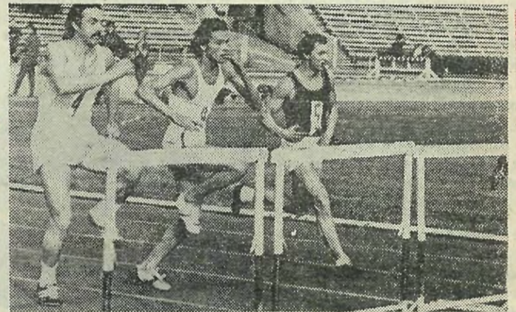
◆ Н. Кондратьев. Доли секунды .