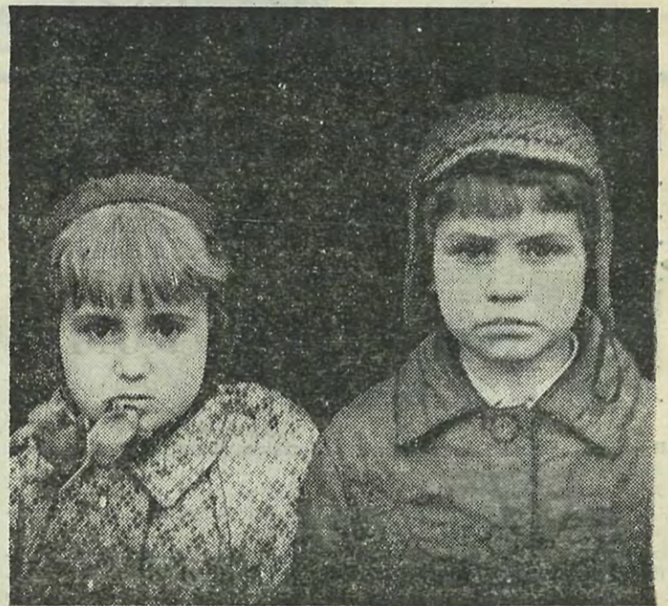
◆ Ю. Андреев. «Мы помним...»