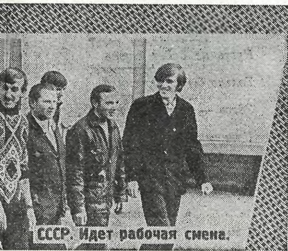
СССР. Идет рабочая смена.

В буржуазном обществе основной свободой считают свободу частного предпринимательства, основополагающим правом — право «делать деньги!» Очевидно,