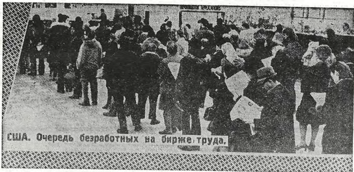
США. Очередь безработных на бирже труда.

Наша новая Конституция первой в мире провозглашает это жизненно важное для человека право. По объему и темпам жилищного строительства Советский Союз занимает первое место в мире. Абсолютное большинство советских граждан получают от государства квартиры бесплатно, а квартирная плата у нас, включая газ, электричество, горячую воду, телефон, настолько низка, что приезжающие в СССР западные туристы этим цифрам не хотят