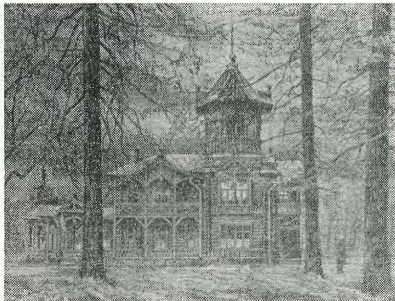
Зимние сумерки.