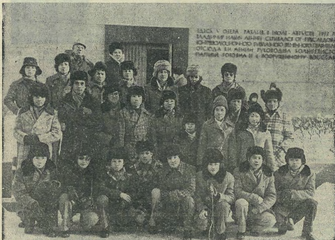
НА СНИМКЕ: у мемориала В. И. Ленина в Разливе.