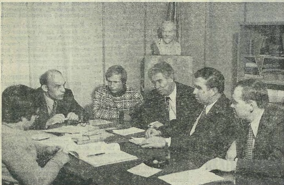
В партийном бюро физико-металлургического факультета. Идет обсуждение хода сельскохозяйственных работ в Волосовском районе.