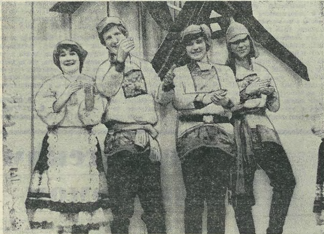
Один из самых любимых видов искусств у политтехников — театр. НА СНИМКЕ: студенты инженерно-экономического факультета в спектакле «Великие голодранцы».

Н. КОЖЕВНИКОВ, председатель художественного совета ЛПИ