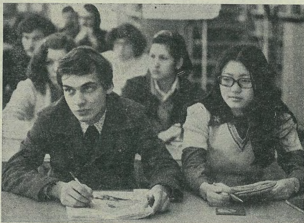
НА СНИМКЕ: студенты готовятся к экзаменам в кабинете общественных наук.