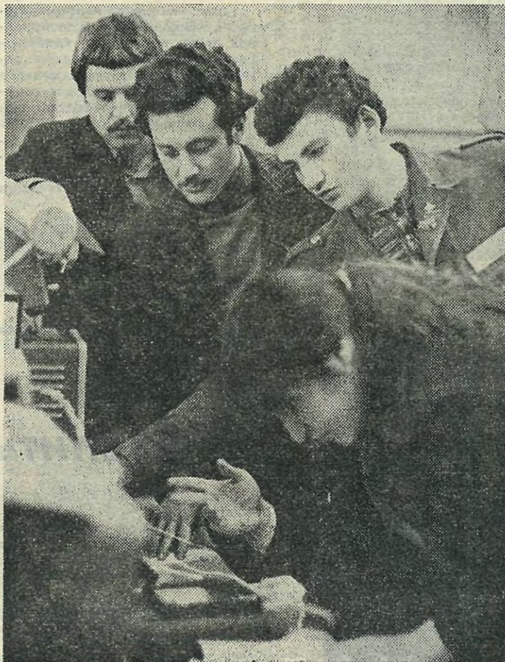
Академическая группа 434/2 — одна из лучших на четвертом курсе энергомашиностроительного факультета. В ее дружном коллективе пять отличников. Все студенты группы имеют общественное поручение.