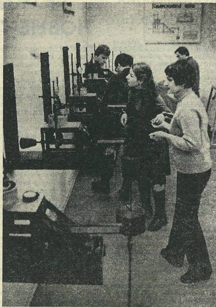
У будущих гидротехников — студентов 412/2 группы — лабораторная работа по механике грунтов.