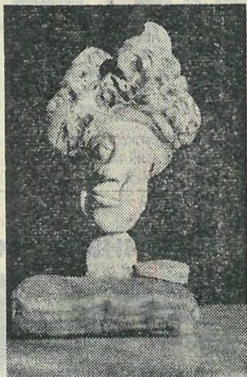
На снимке: работы, выполнен- ные А. Вещуновым.

А. ВЕЩУНОВ, доцент кафедры экономики и управления машиностроитель- ным производством