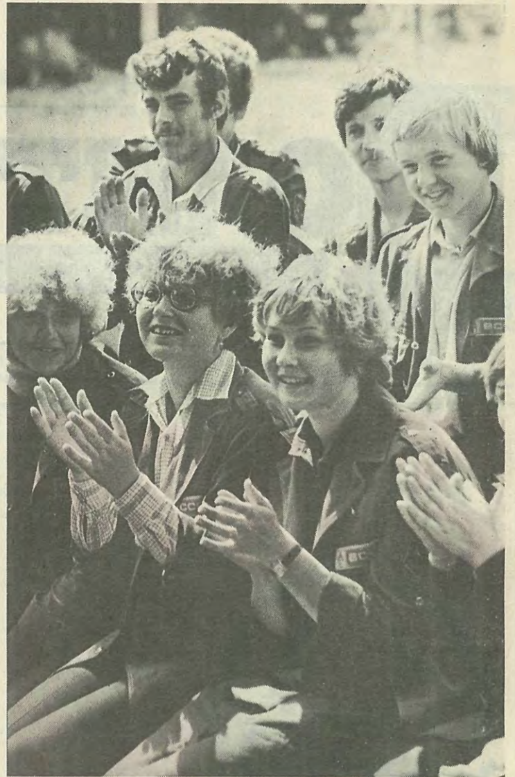
Студенчества счастливая пора...