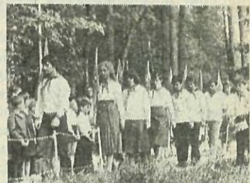
На снимке: на торжественной линейке, посвященной открытию первой лагерьной смены 1982 года.

Взрослые делали все для того, чтобы отдых ребят прошел хорошо. Полным ходом идет подготовка пионерского лагеря «Алые паруса» к встрече детей. В этом году в чудесном месте под Зеленогорском отдохнут более 800 детей сотрудников института. И ребята, и вожатые-студенты института с нетерпением ждут встречи со своим любимым лагерем.