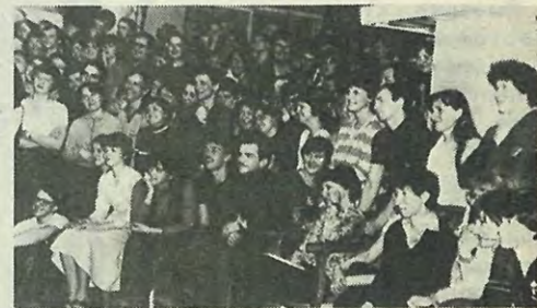
На снимке: в зале нет равнодушных.