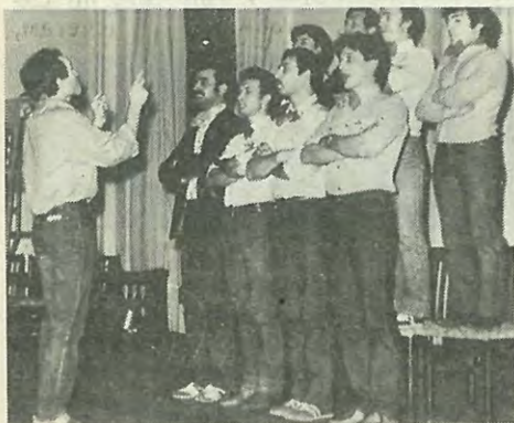
На снимке: выступает хор «мальчиков-политехников».