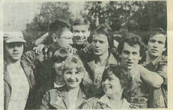
НА СНИМКЕ: бойцы ССО «Синтез».