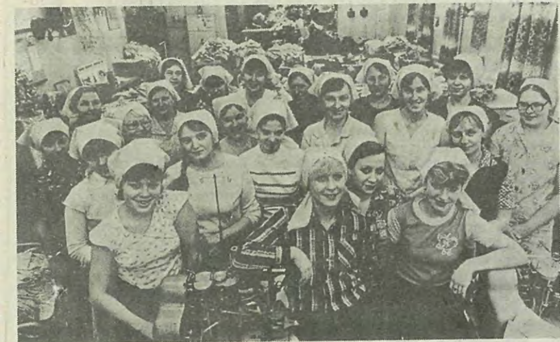
Производство товаров культурно-бытового и хозяйственного назначения составит в 1985 году 55,8 миллиарда рублей, или на 6 процентов больше, чем в 1984 году. Розничный товароборот вырастет на 5,2 процента по сравнению с 1984 годом и составит 334 миллиарда рублей.

Дело чести каждого трудового коллектива, каждого труженика — достойно встретить предстоящие выборы; в завершающем году пятилетки работать ударному. Каждый день выполнять и перевыполнять свои задания и обязательства, создавать надежную основу для уверенного старта в новой пятилетке. Будем постоянно помнить, что свое счастье и благополучие мы куем сами — все вместе и каждый в отдельности.