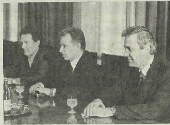
строения и электрических машин; где они познакомились с постановкой научно-исследовательской работы, а также обменялись мнениями о дальнейшем совершенствовании подготовки специалистов для ГДР.

На Пискаревском мемориальном кладбище делегация возложила цветы к монументу Матери-Родины.