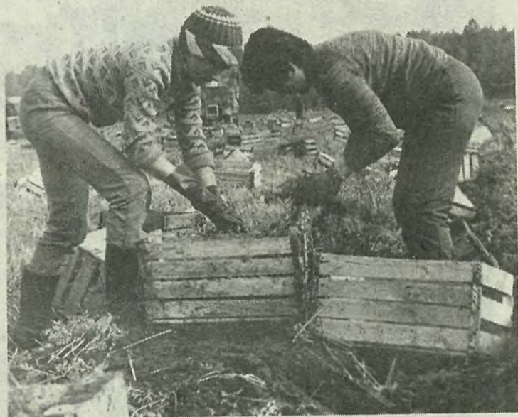
«Здравствуй, новый учебный год» (сентябрь — пора «совхозная»).