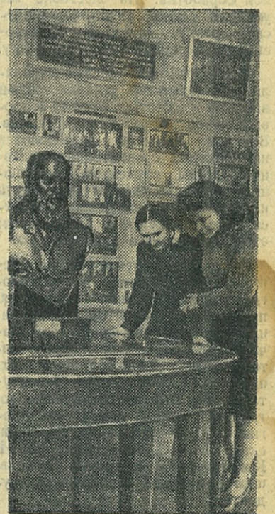
На выставке, посвященной жизни и творчеству А. Н. Островского в Театральном музее

Кровный и коренной патриотизм Островского и несравненное живое богатство его таланта сделали вечно молодое творчество Островского близким и любимым «своим» и для советского человека наших дней.