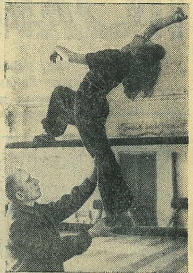
Спортивное лето вступает в свои права. Гимнасты проводят в спортивных залах последние занятия. Скоро они перенесут тренировки на открытый воздух. Для гимнастов сооружается большой гимнастический городок. На снимке: занятия гимнастов в спортзале.