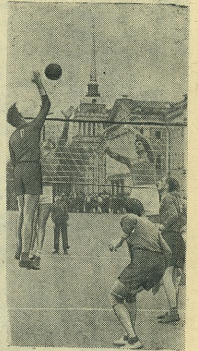
Волейбольный матч в День Победы 9 мая 1948 года

Итак, мы требовали улучшить преподавание, а товарищи почему-то проходят мимо этого и в своих откликах затрагивают второстепенную, в данном случае, часть статьи о роли конспекта».