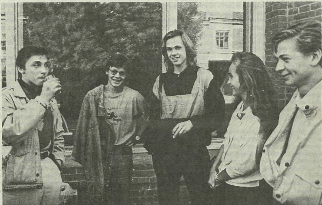
ФТК. Группы 381/1 и 381/6. — Хоть какое-то разнообразие в нашей монотонной жизни: строили баррикады, впервые стояли в очереди за газетами...

— Пожеланий много. Частенько сталкиваемся с личной неприязнью со стороны преподавателей, опять сдали весной, как ни протестовали, незаконный теоретический зачет по программированию, и деканат не смог помочь, обратно к кафедре отсылали.