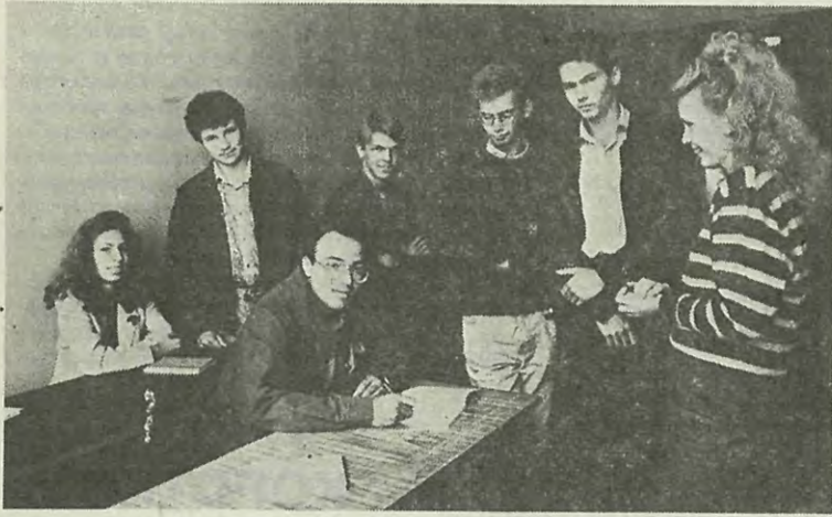
ЭЛМФ. Группа 223/2 — Мы не должны были, мы не могли быть пассивными наблюдателями...