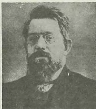
Возвращение из первой эмиграции, начало работы в СПбПИ (1906 г.)