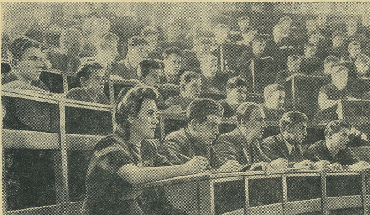
На первой лекции. Студенты первого курса электро-механического факультета слушают лекцию по основам марксистско-ленинизма