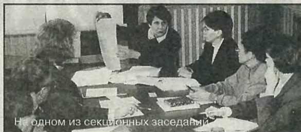
На одном из секционных заседаний

Также обсуждены вопросы обеспечения экологической безопасности страны, сохранения и дальнейшего развития научно-образовательного и культурного потенциала России, создающего фундамент для достойного места России в мировом сообществе, сохранения российских научных школ, получивших мировое признание. Отмечена острая проблема, связанная с низким уровнем современной квалификации менеджеров, особенно в области стратегического управления предприятиями различных форм собственности, необходимость серьезных корректив системы послевузовского образования менеджеров, с акцентом на воспитание