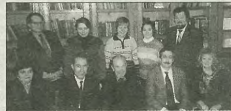
Коллектив кафедры «Экономика и менеджмент технологий и материалов»