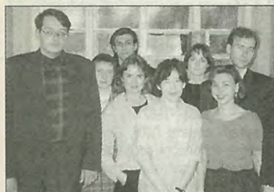
Дипломники кафедры ИСЭМ 1996 г.

К наступающему столетнему юбилею факультета и кафедры института выпускают сборники материалов, в которых рассказывают о своей истории, об ученых, работавших и работающих на кафедрах факультета, о своих знаменитых выпускниках. Такой сборник вышел и на ФЭМе. В нем много интересного, он богато иллюстрирован и позволяет создать общее впечатление о факультете, впервые открытом в высшем учебном заведении России.