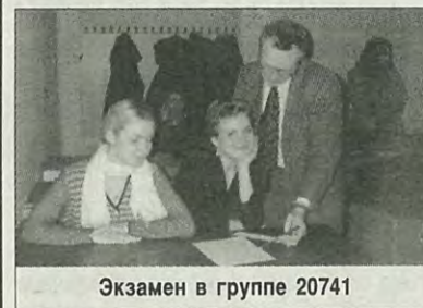
Экзамен в группе 20741

— ЛПИ — «мой семейный институт». Я — третье поколение, учащееся здесь.