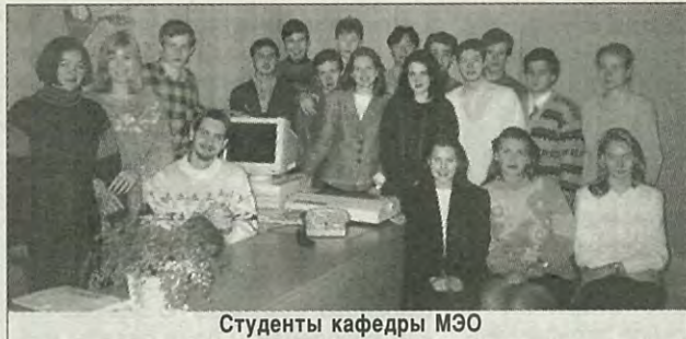
Студенты кафедры МЭО

Из правил приема в Петроградский политехнический институт императора Петра Великого.