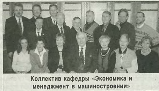
Коллектив кафедры «Экономика и менеджмент в машиностроении»

В 1960 г. в связи с возникновением необходимости использования математических методов и электронно-вычислительных машин для оптимального планирования и управления предприятиями, объе-