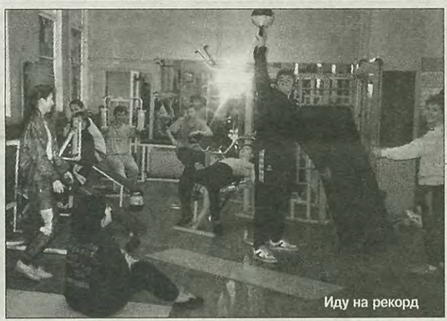
Иду на рекорд