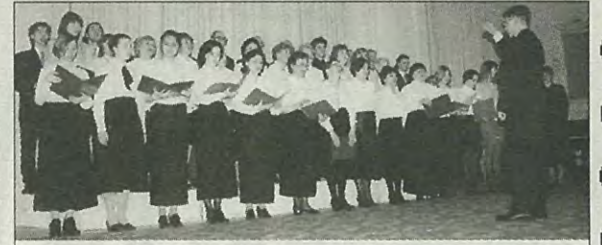
Академический хор политехников на концерте в Актовом зале