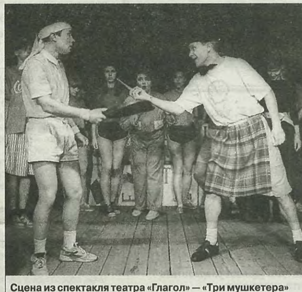
Сцена из спектакля театра «Глагол» — «Три мушкетера»