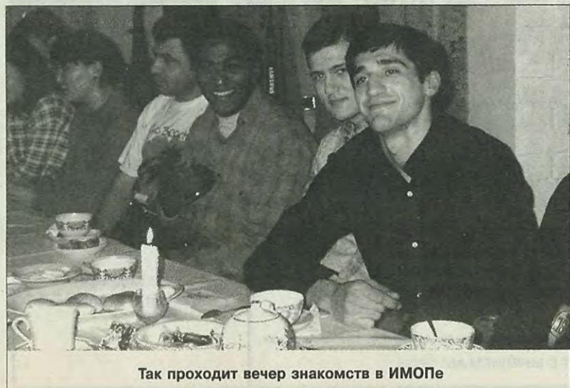
Так проходит вечер знакомств в ИМОПе