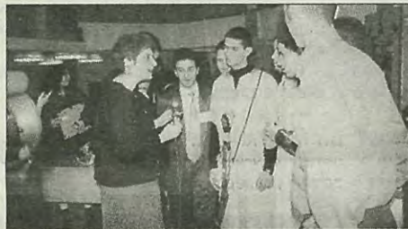
Телевидение берет интервью у марокканских студентов во время фестиваля