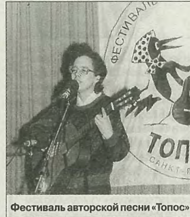
Фестиваль авторской песни «Топос»