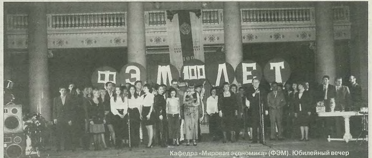
Кафедра «Мировая экономика» (ФЭМ). Юбилейный вечер

И в этом случае вы поймете, что очередная сессия — по крайней мере, в ближайший год — вам уже не грозит.