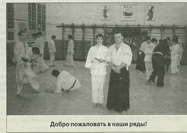
Добро пожаловать в наши ряды!