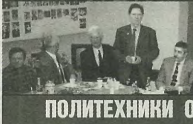
ПОЛИТЕХНИКИ О СПОРТЕ

К 100-летию университета были изданы два сборника, посвященных развитию физической культуры и спорта в нашем учебном заведении за все годы его существования.