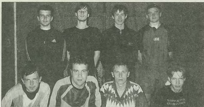
Победитель турнира команда «Сочава Bulls»