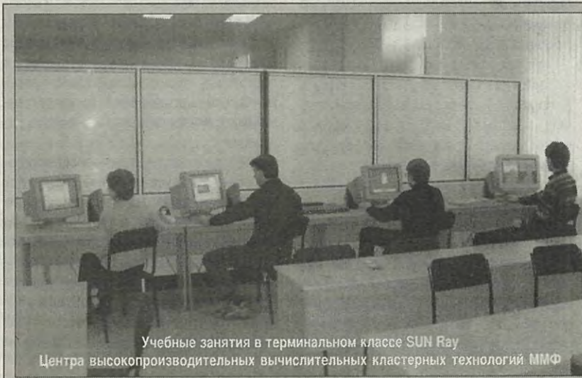
Учебные занятия в терминальном классе SUN Ray Центра высокопроизводительных вычислительных кластерных технологий ММФ

Литературная студия приглашает студентов Технического университета на занятия поэтическим мастерством. Занятия проходят каждый нечетный вторник месяца в 123 ауд. Главного здания в 18.00.