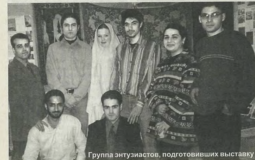
Группа энтузиастов, подготовивших выставку