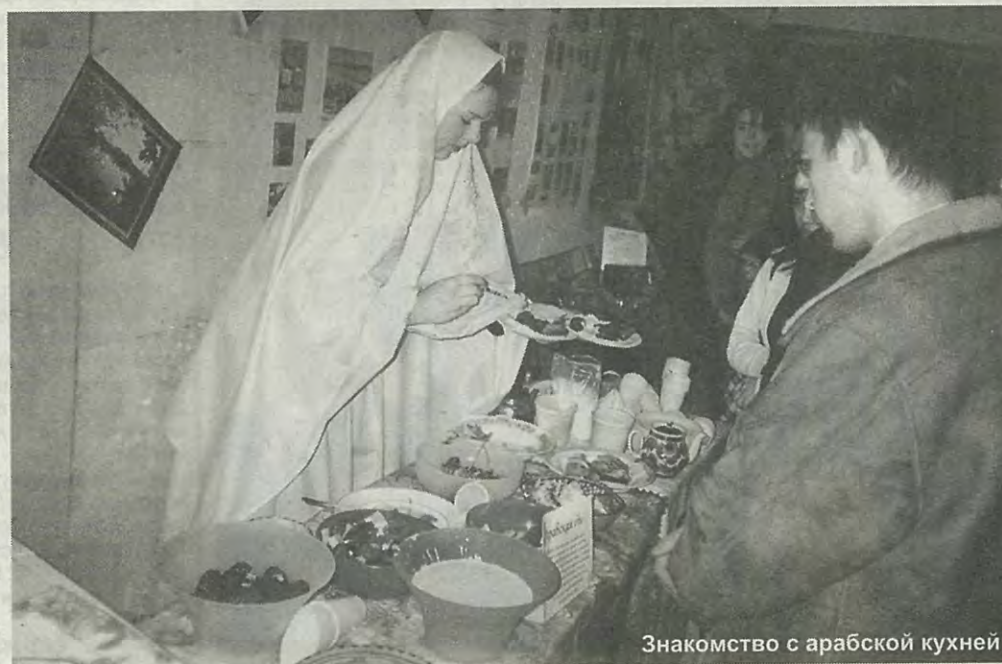
Знакомство с арабской кухней