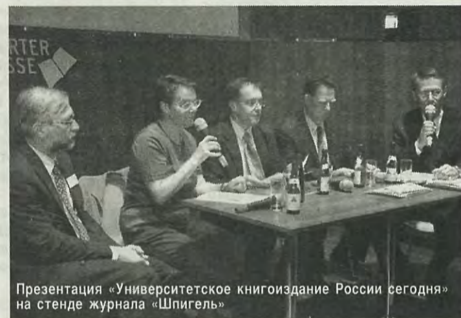
Презентация «Университетское книгоиздание России сегодня» на стенде журнала «Шпигель»

Если во Франции существует государственная программа «Чтение», направленная на развитие процесса чтения у молодежи, если в той же Германии проблемам читающей молодежи уделяется серьезное внимание как со стороны властей, так и тех же масс-медиа, то в нашей стране все чаще слышишь утверждение, что книга — источник выгоднейшего бизнеса! Бесспорно, книги Дарьи Донцовой, выпускаемые миллионными тиражами, имеют право на такое утверждение. Однако, зададим вопрос: «Сеют ли разумное, добро, вечное такие книги?». Возможно, в какой-то мере да, но сопоставляя такие произведения с классикой или с рядовым учебником по механике, вполне можно сделать вывод о пользе для общества