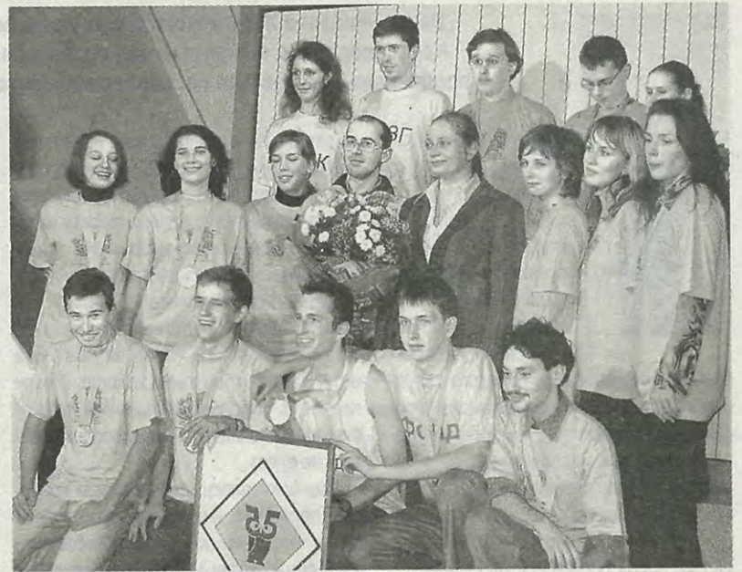
Краса и гордость Альма-Матер

И всё же самым лучшим из всей эпопеи с получением стипендии я считаю то, что теперь у меня появилась группа классных друзей-потанинцев.