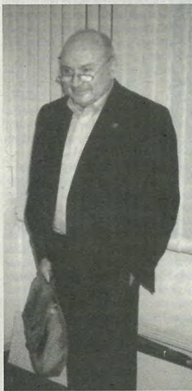
Автор со знаменитым портфелем

— Это трудно. Та жизнь была жуткой, а эта сволочная. Либо тот, либо этот... Когда говорят о влиянии семьи на ребенка в наши дни — это несерьезно. Литература, искусство и кинематограф наших дней — они определяют все. В семье их влияния не перебороть. Телевидение — насилие, война, расчлененные тела, вампиры, выродки, ведьмы. Что делать? Не включать телевизор? Закрыть окно? Дышать кислородной подушкой? Не могу своего ребенка от этого оградить!»