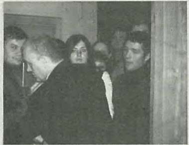
Очередь за автографами

го зала, в котором со сцены выступает Маэстро. Чувствовалось, что это добрый и веселый человек, который хочет добра и нам и старается скрасить нашу жизнь своим умным юмором. На самые неожиданные вопросы он и реагировал неожиданно. Кто-то поинтересовался, как гость Вечеров представил бы себя во фраке. Выяснилось, что фрак у него уже есть. Выглядит он в нем хорошо. И если повезет с Нобелевской премией, то проблемы, как появиться перед королем Швеции, не будет.