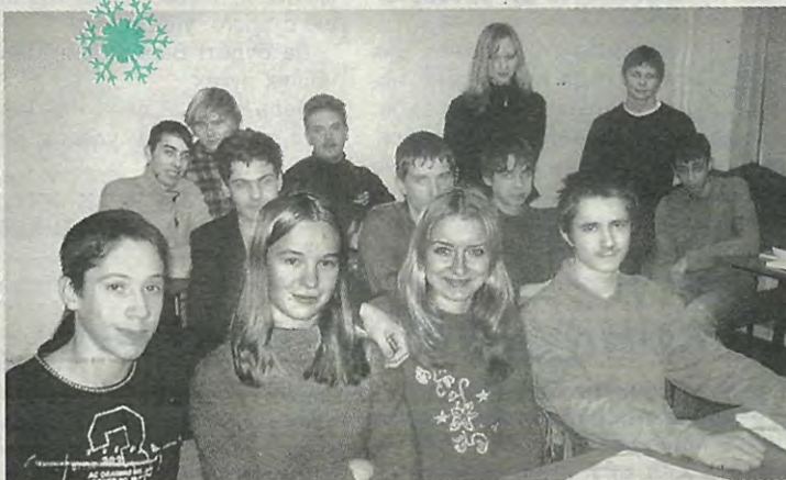
Абитуриенты группы Д-1

- Хотим стать студентами Политеха. Мы мужественно проводим вечера на подготовительных курсах, стараемся делать все домаш-