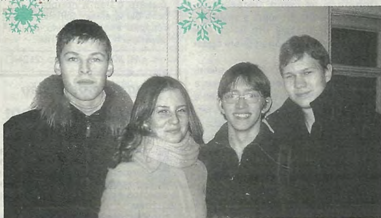
Студенты гр. 1042/2, ММФ

- Я не делал ничего плохого. Не обижал близких людей, никого не обделил вниманием и понял, насколько родные для меня важны.