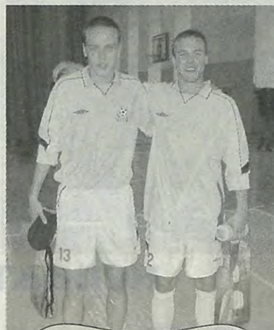
«Политех» — пятикратный обладатель Кубка Санкт-Петербурга по мини-футболу

Немного о победителе. В этом году ФК «Политех» — единственная профессиональная команда города, созданная на базе учебного заведения, — отмечает свой де-