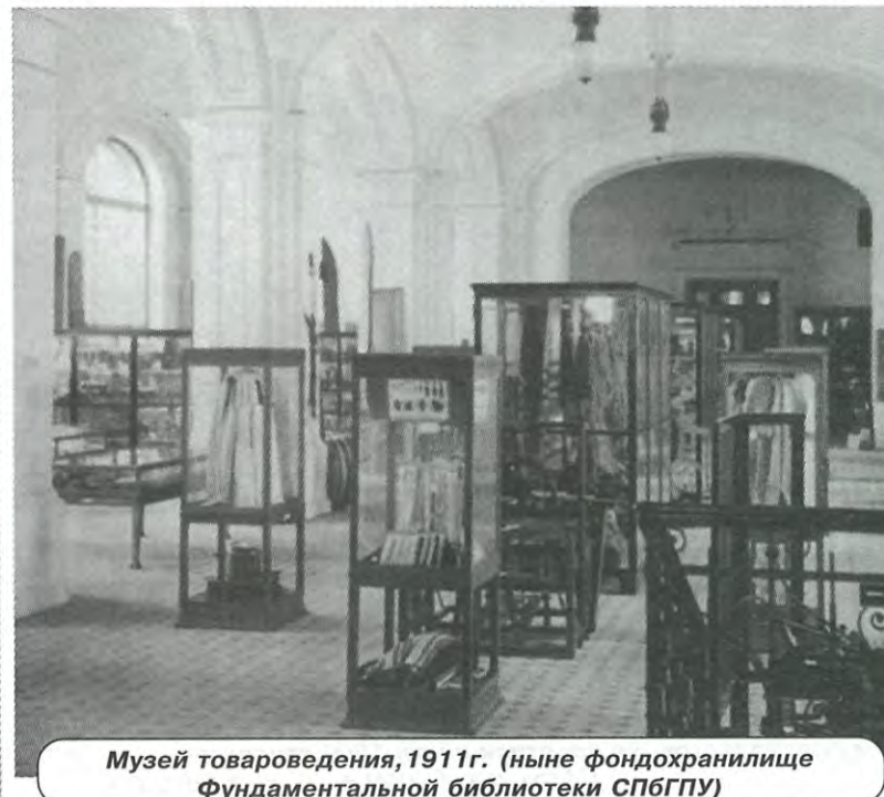
Музей товароведения, 1911г. (ныне фондохранилище Фундаментальной библиотеки СПбГПУ)