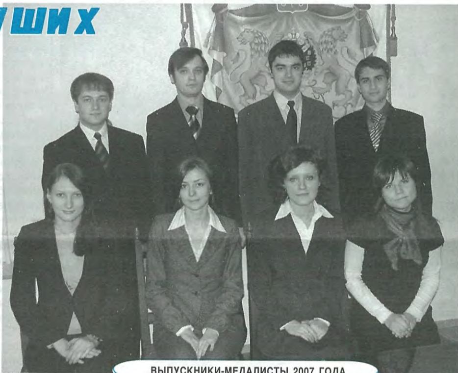
ВЫПУСКНИКИ-МЕДАЛИСТЫ 2007 ГОДА

Эти выпускники получили не только диплом «с отличием», но и активно участвовали в научно-исследовательской работе. Среди них есть призеры университетских, городских и общероссийских студенческих предметных олимпиад и конкурсов. Многие из них — участники международных научно-практических конференций. И абсолютно все они выступали с докладами и принимали участие в Неделях науки, ежегодно проводимых в университете.