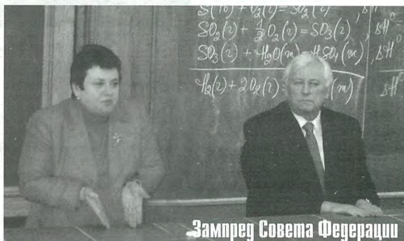
Зампред Совета Федерации