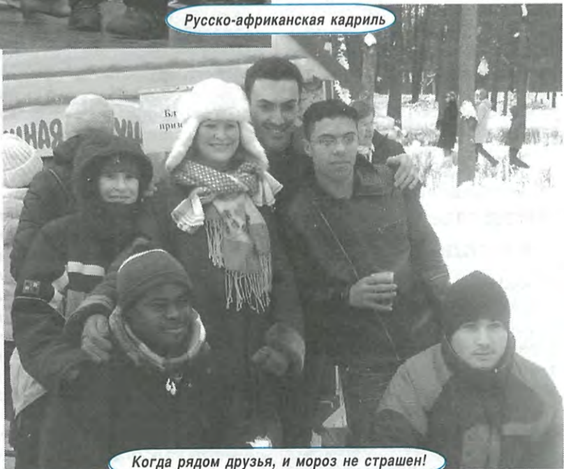
Когда рядом друзья, и мороз не страшен!

В соревнованиях приняли участие студенты 1-6 курсов 18-ти факультетов. Особую активность проявили ЭНМФ, РФФ, ММФ, ФМФ, ЭлМФ, ФТК. Всего соревновался 91 человек: 18 девушек (дистанция — 3 км), 68 юношей (дистанция — 5 км) и пять сотрудников. И всё это несмотря на трудности, которые пришлось преодолевать лыжникам.