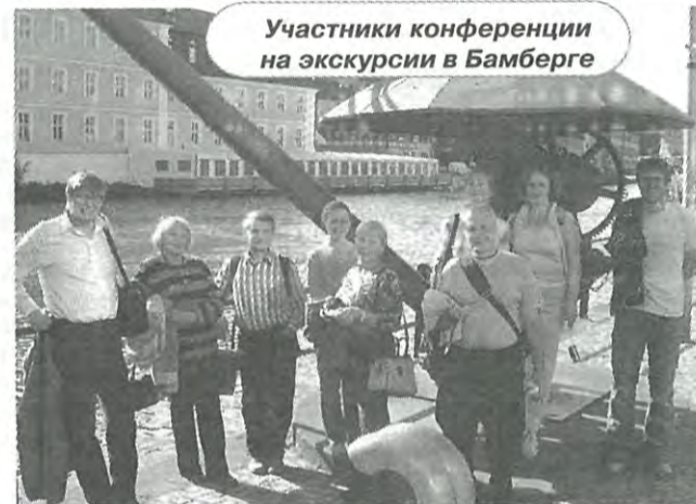
Участники конференции на экскурсии в Бамберге

Хочется отметить гостеприимство немецкой стороны, особенно – доброжелательность и отзывчи-