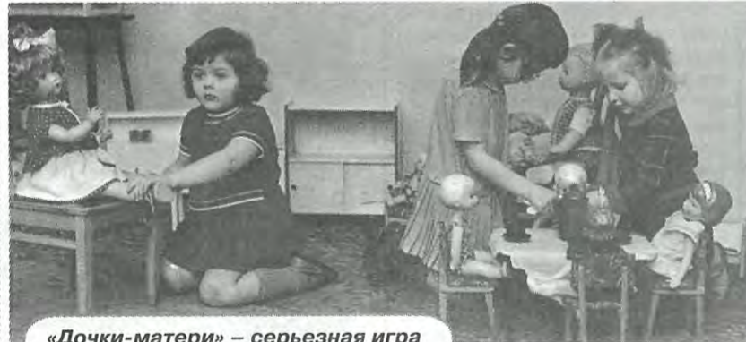
«Дочки-матери» – серьезная игра

...20 декабря 1982 года в день 50-летия детского сада «свой дом» пришли навестить его давние воспитанники. Это был большой праздник: с песнями и танцами детей, с подарками и поздравлениями.