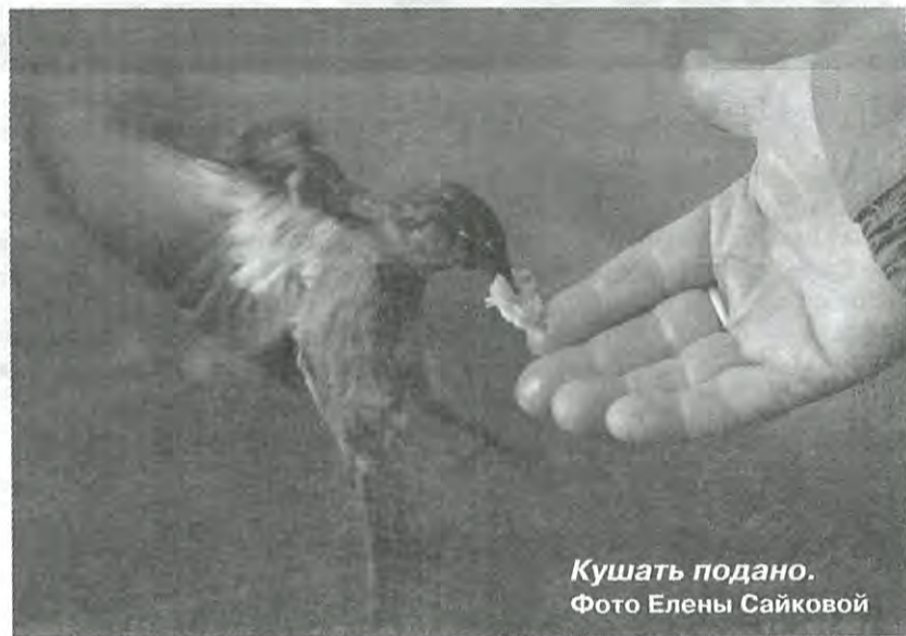
Кушать подано.

В последний день выставки прошло награждение победителей. На этой торжественной ноте осенняя фотовыставка была закрыта, чтобы вновь открыться весной. Ждем новых работ и интересных идей!