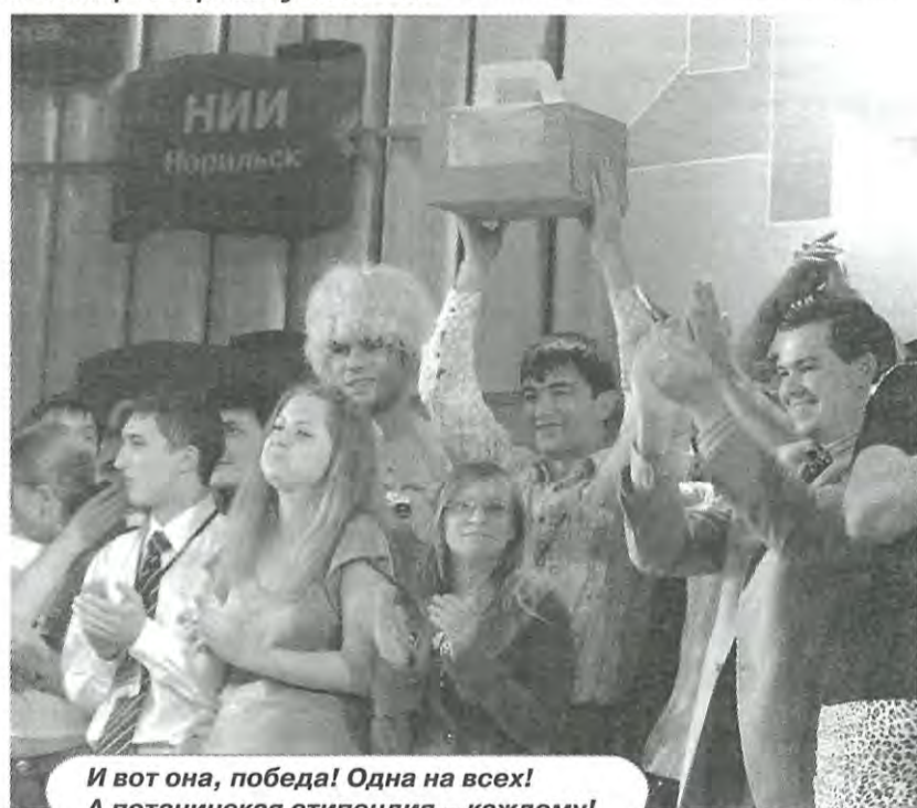
И вот она, победа! Одна на всех! А потанинская стипендия — каждому!

В финале проходила игра КВН, которую мы тоже не обошли стороной. По итогам всех мероприятий 60 студентов из 230 стали стипендиатами Потанинского фонда. Критерии отбора студентов: работа в команде, реализация проекта и отзывы руко-