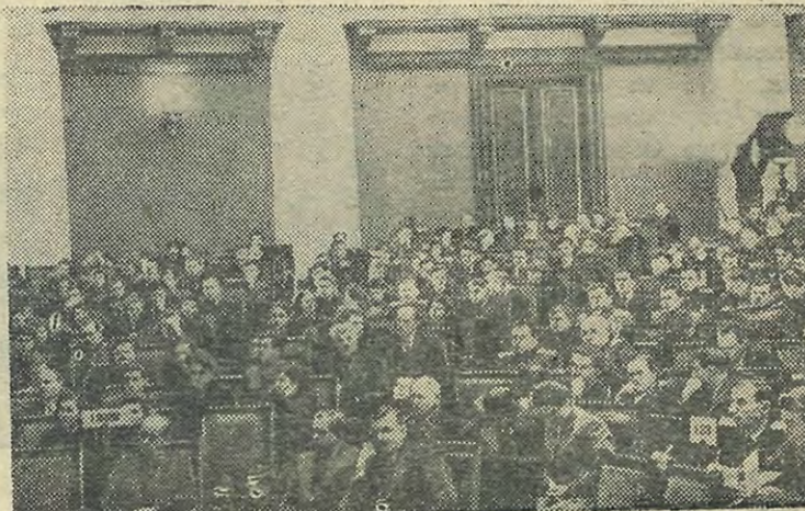
В зале конференции

На юбилейные торжества ожидается приезд многочисленных гостей — воспитанников нашего института, делегатов различных научно-исследовательских институтов, заводов и др.