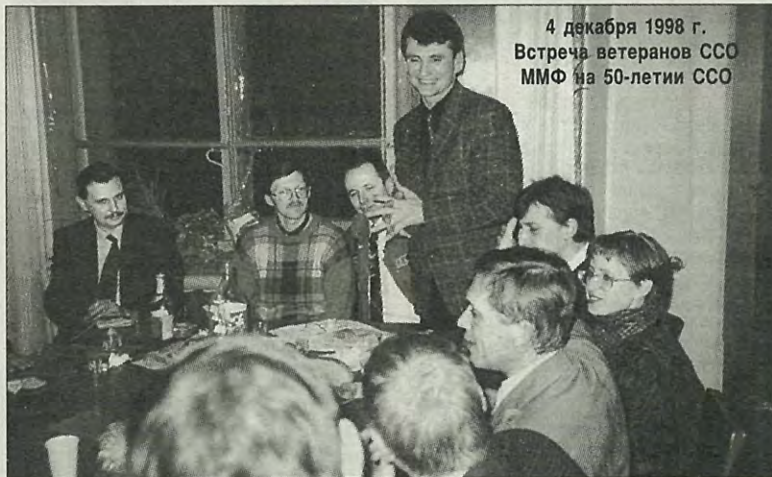
4 декабря 1998 г. Встреча ветеранов ССО ММФ на 50-летию ССО

Союзной карты точки не забыть, где от ответных сил трещали кости, ломило мышцы и хотелось выть. Не выли. Мы «в законе» в Княж-Погосте!