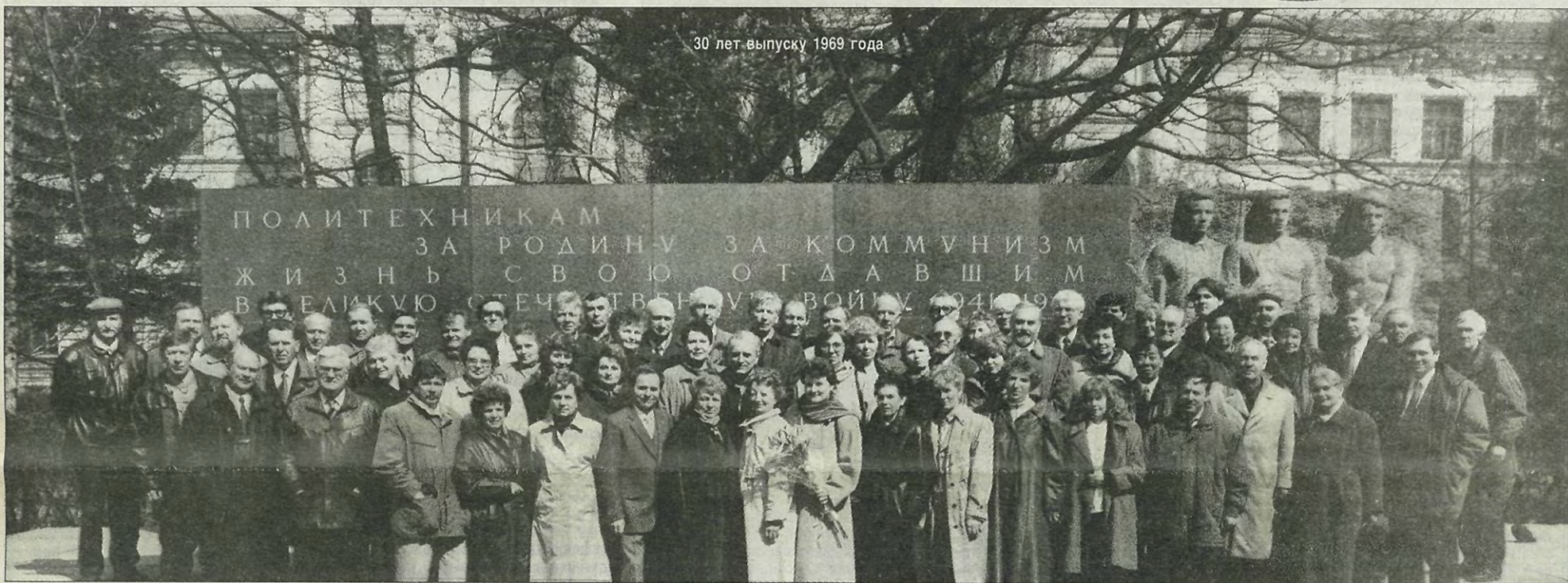
30 лет выпуску 1969 года