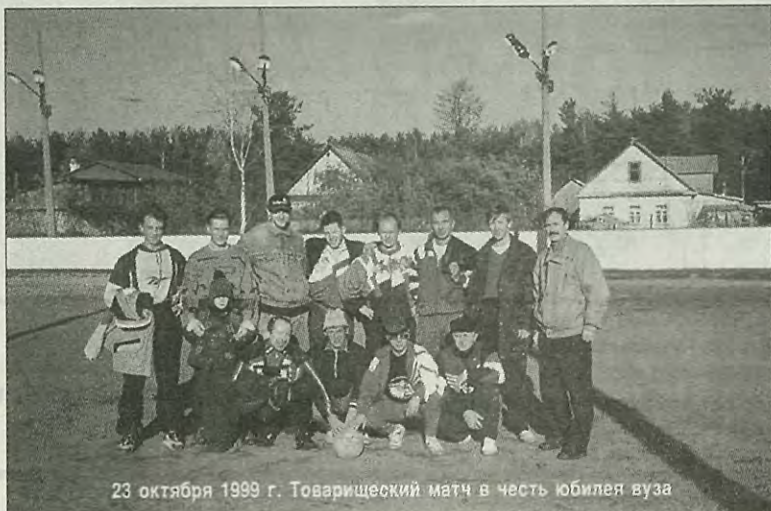
23 октября 1999 г. Товарищеский матч в честь юбилея вуза