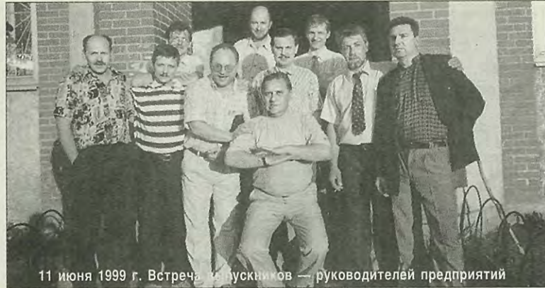
11 июня 1999 г. Встреча выпускников — руководителей предприятий

ко и В. Лапин) подготовили и провели 11 июня 1999 г., на нее пришло почти 40 человек (были и иногородние). На этой встрече непосредственно ставился на «голосование» вопрос о создании клуба ММФ, о необходимости глубокой интеграции между выпускниками, о тесной связи с факультетом. Все присутствующие единогласно высказались «за» эти начинания. Может, так бы все и прошло, но были очень интересные последствия. Я получил со временем три сообщения с благодарностью за то, что встреча помогла выпускникам решить свои производственные вопросы и сотрудничество у некоторых продолжается до сегодняшнего дня. Но самое интересное то, что появилась информация от других выпускников с обидами и упреками, что их, мол, не позвали. И тогда я стал понимать, что что-то «живое» есть в этой работе, что здесь есть внутренняя энергетика, если хотите — самоорганизация. Я не оговорился насчет работы — нет, я на себе испытал и чувствую, что это большая работа. Может быть, не очень сложная, но однозначно ответственная. После встречи 11 июня 1999 г. контакты не прекратились, а стали даже более частыми, и выпускники (участники встречи) стали все назойливее спрашивать: ну, как наш клуб?