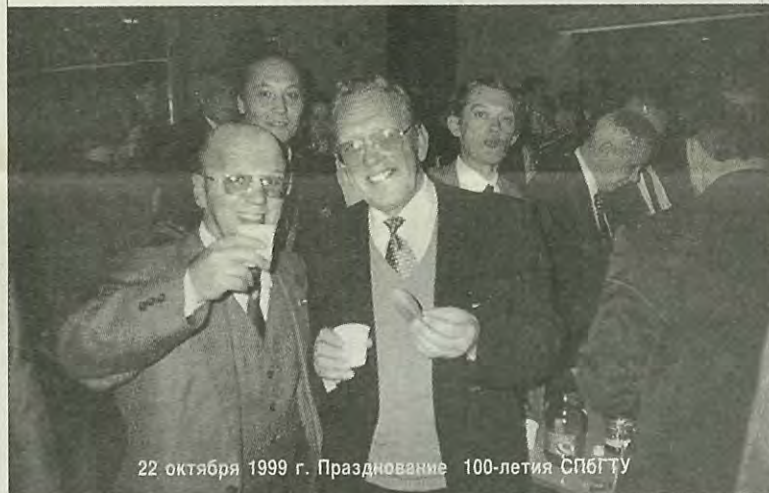
22 октября 1999 г. Празднование 100-летия СПбГТУ

Последней «каплей» была небольшая встреча с выпускниками на праздновании 100-летия университета 22—23 октября 1999 года. Небольшой встреча была потому, что факультет не смог выделить большое количество билетов для выпускников, а концертный зал «Октябрьский» не смог вместить всех желающих. Но встреча все равно получилась. Прямо был поставлен вопрос об учреждении организации «Клуб выпускников ММФ». Правда, голоса разделились, что учреждать: коммерческую или некоммерческую организацию, и кто будет учредителями. Именно на этой встрече уже более четко звучали цели и задачи: постоянное место встречи, «горячая линия», банк данных,