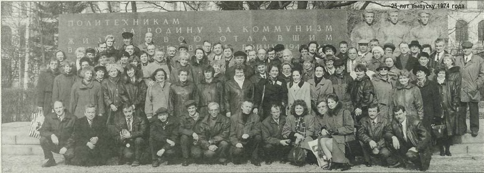
25 лет выпуску 1974 года

Учредитель газеты: коллектив Санкт-Петербургского государственного технического университета Газета зарегистрирована исполкомом Ленинградского горсовета народных депутатов 21.01.91 г. № 000255