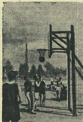
Баскетбольная команда института на тренировке.