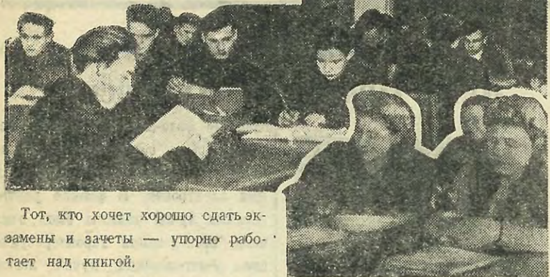
Тот, кто хочет хорошо сдать экзамены и зачеты — упорно работает над книгой.