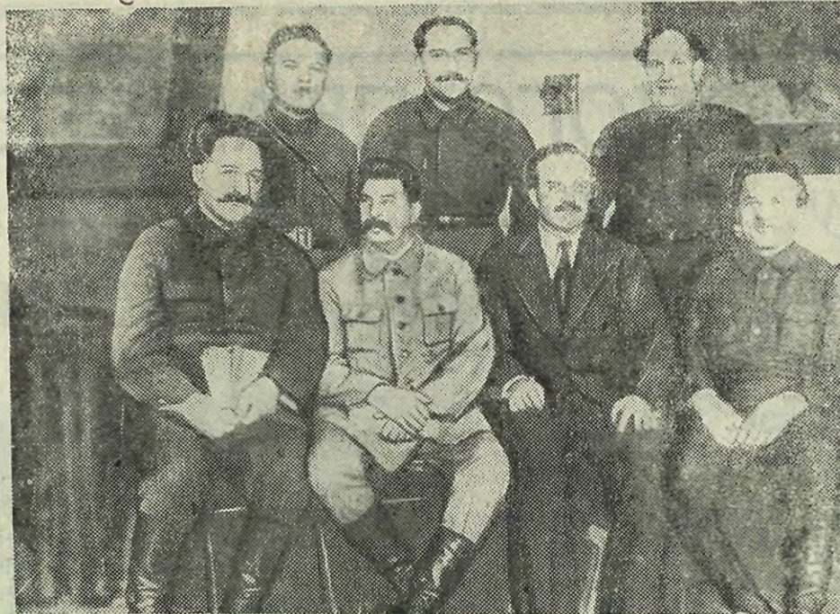
Товарищи Орджоникидзе, Сталин Молотов, Киров; (стоят) Ворошилов, Каганович и Куйбышев (1934 г.)

И среди рабочих есть передовые и есть отсталые, не говоря уже об уродах. Также и среди крестьян: есть и передовые, есть и отсталые. Есть, конечно, и хуже, чем просто отсталые. Передовые люди нашего времени являются активными и самоотверженными строителями коммунизма, лучшими борцами за укрепление нашего государства. За этими передовыми людьми нашего обще-