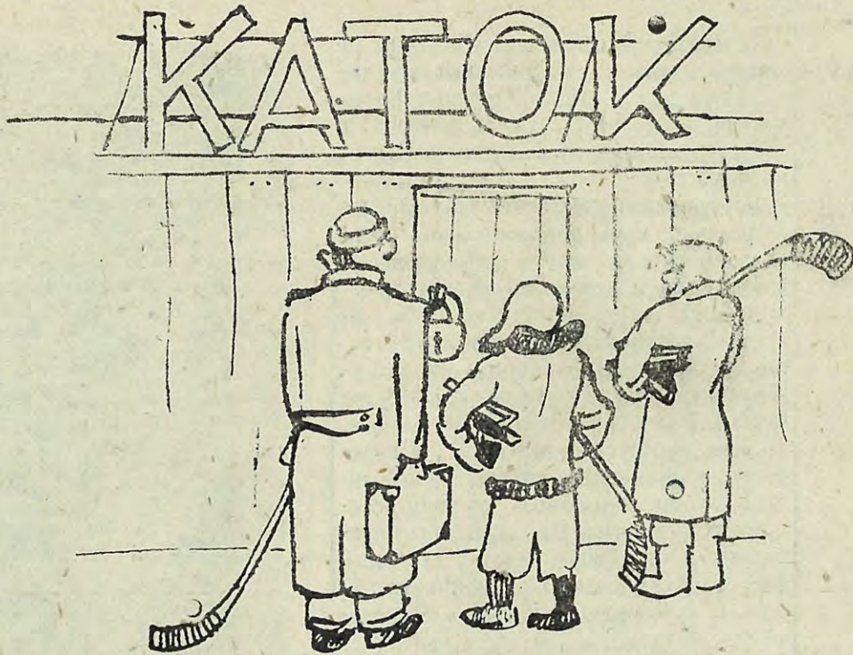
Иллюстрация к отчету СДО „Авангард“

Хоккенсты ЛИИ, одерживавшие в прошлые годы немало побед, в сезоне 1939—40 г. не участвовали в соревнованиях, т. к. своего катка не было, а арендованный не пускали из-за неуплаты денег.