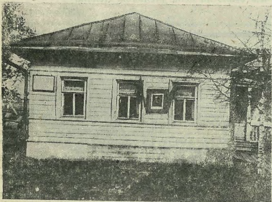
Дом в Вологде, где жил в царской ссылке товарищ В. М. Молотов в 1909, 1910 и 1911 гг.