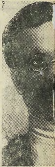
В. М. Молотов XIV съезде от Московской организации (Ленинградский Револьюционер)

В период февральской буржуазно-демократической революции тов. Молотов — член Петроградского комитета большевиков, член Исполнительного комитета Петроградского совета. Тов. Молотов руководил восстановлением и выпуском газеты «Правда», принимал активное участие в работах апрельской партийной конференции и VI съезда партии.