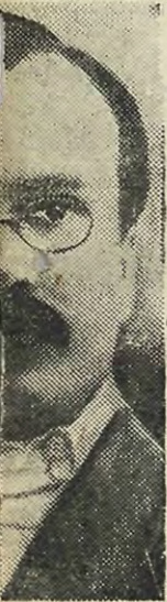
—делегат а ВКП(б) й партийной раци.