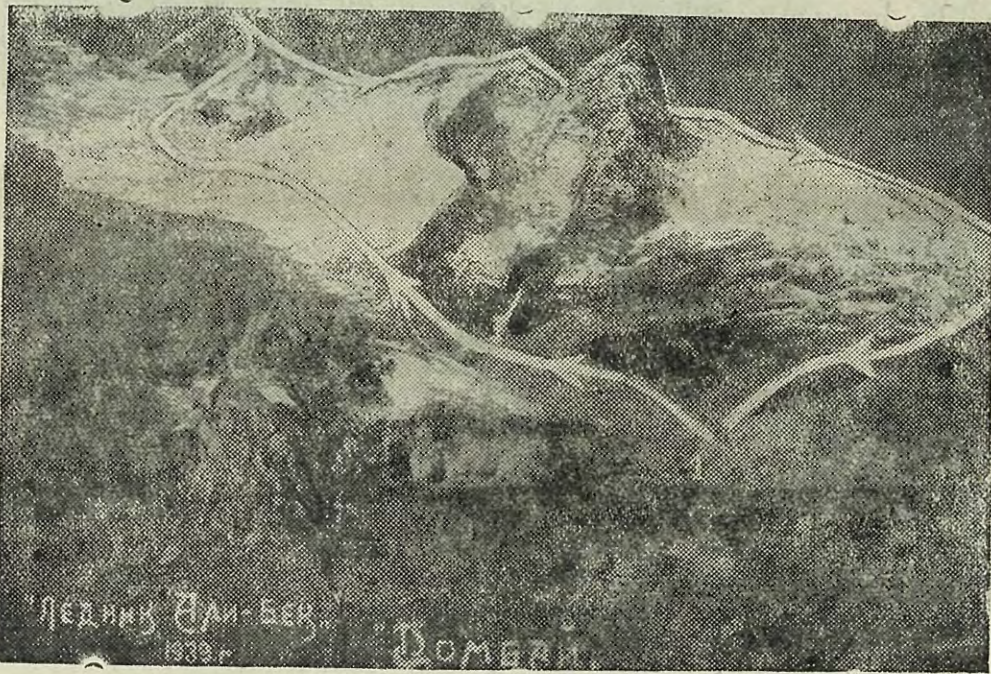
Путь спасательной группы на вершину Эрцог (4). Цифрами обозначены места ночевки группы.

Первые четыре часа пути по нетрудным ледяным и снежным полям мощного глетчера Алибек прошли спокойно. На гребне, спускающемся с вершины Джаловчат, мы