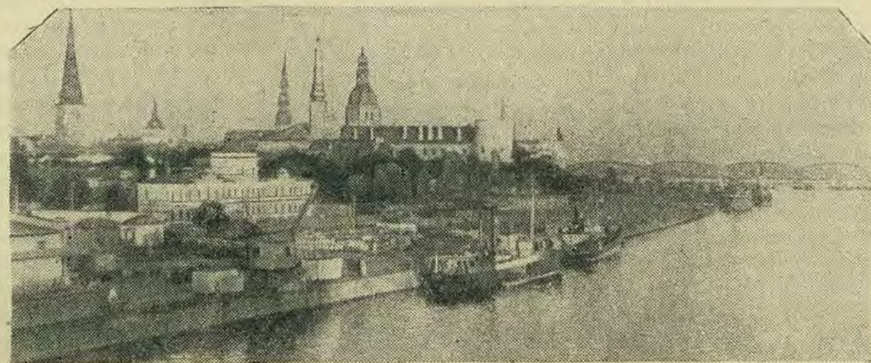
Вид на город Ригу со стороны Западной Двины

По ходатайству Городского Комитета ВЛКСМ, ЦК ВЛКСМ разрешено в Ленинграде проводить в первую очередь выборы комитетов первичных организаций.