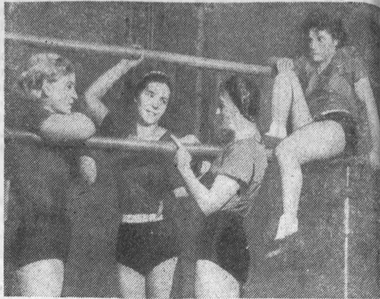
Женская гимнастическая группа общества „Авангард“ ездившая в Киев от нашего института