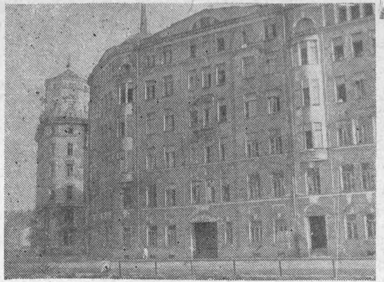
Дом № 32 по набережной р. Карповки, где в октябре 1917 года происходило заседание ЦК РСДРП(б)

Опубликованные тезисы докладов товарища Молотова и товарища Жданова со всей полнотой отражают всемирно-исторические победы в нашей борьбе, определяют задачи дальнейшей борьбы нашего народа за торжество коммунизма. Центральный Комитет партии в решении от 31 января обязал все партийные организации обсудить тезисы докладов товарища Молотова и товарища Жданова. В выполнении решений ЦК ВКП(б) объединенный комитет Ленинградского Горкома и Обкома ВКП(б) от 14 февраля предложил по 15 февраля 1939 года провести во всех первичных организациях закрытые партийные собрания по обсуждению тезисов доклада товарища Молотова „Третий пятилетний план развития народного хозяйства СССР“, тезисов